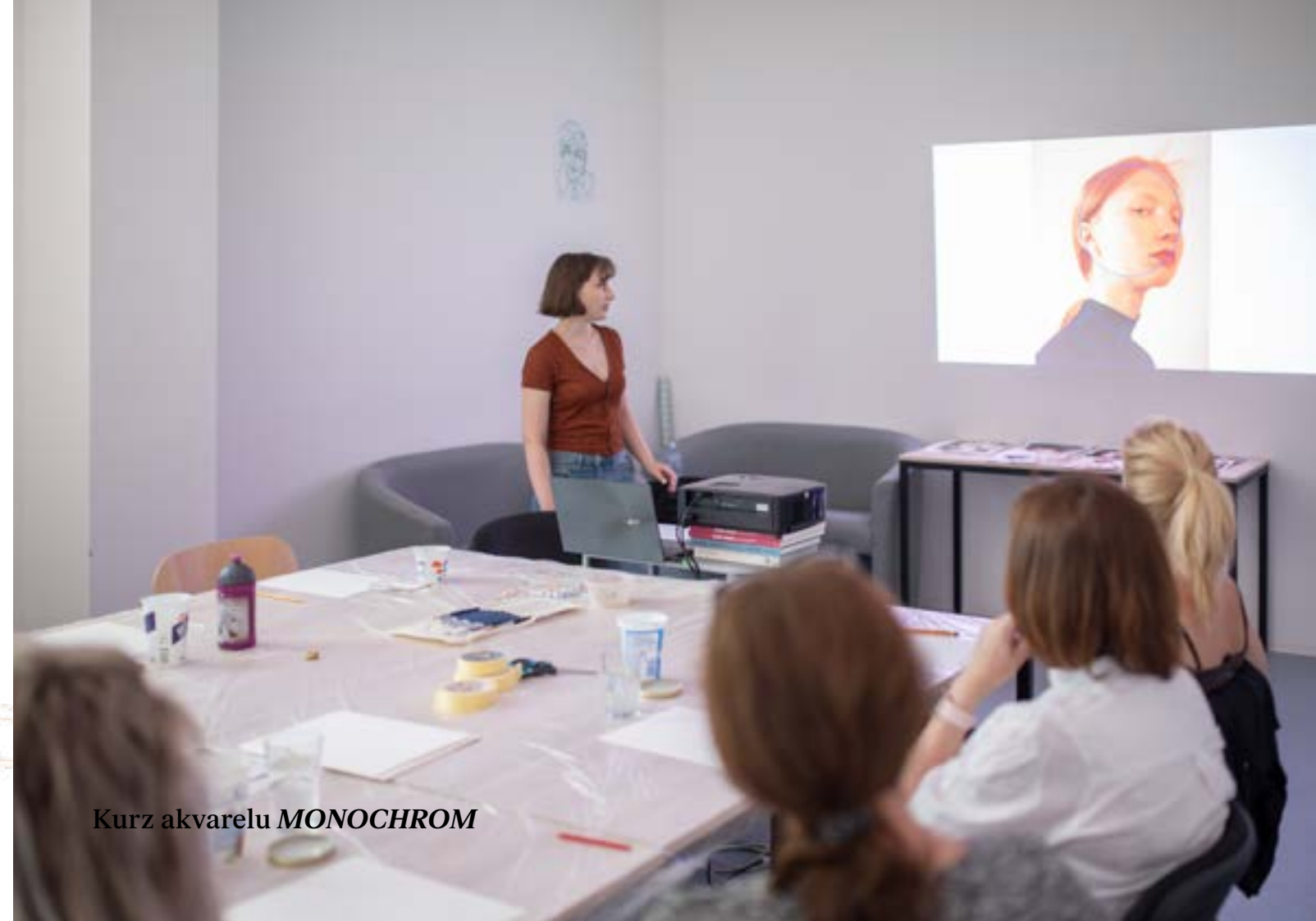
Kurz akvarelu MONOCHROM