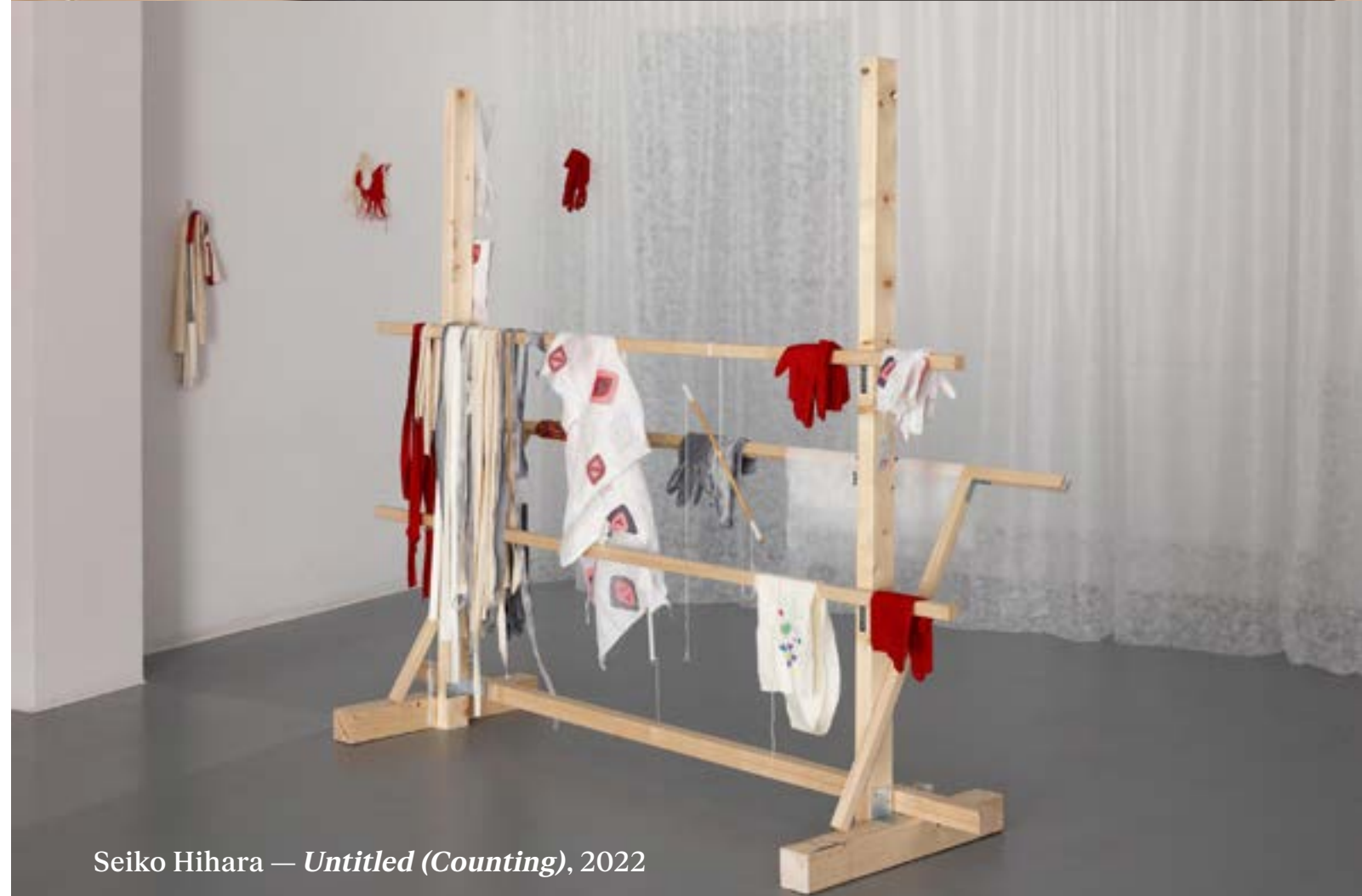
Seiko Hihara — Untitled (Counting) , 2022