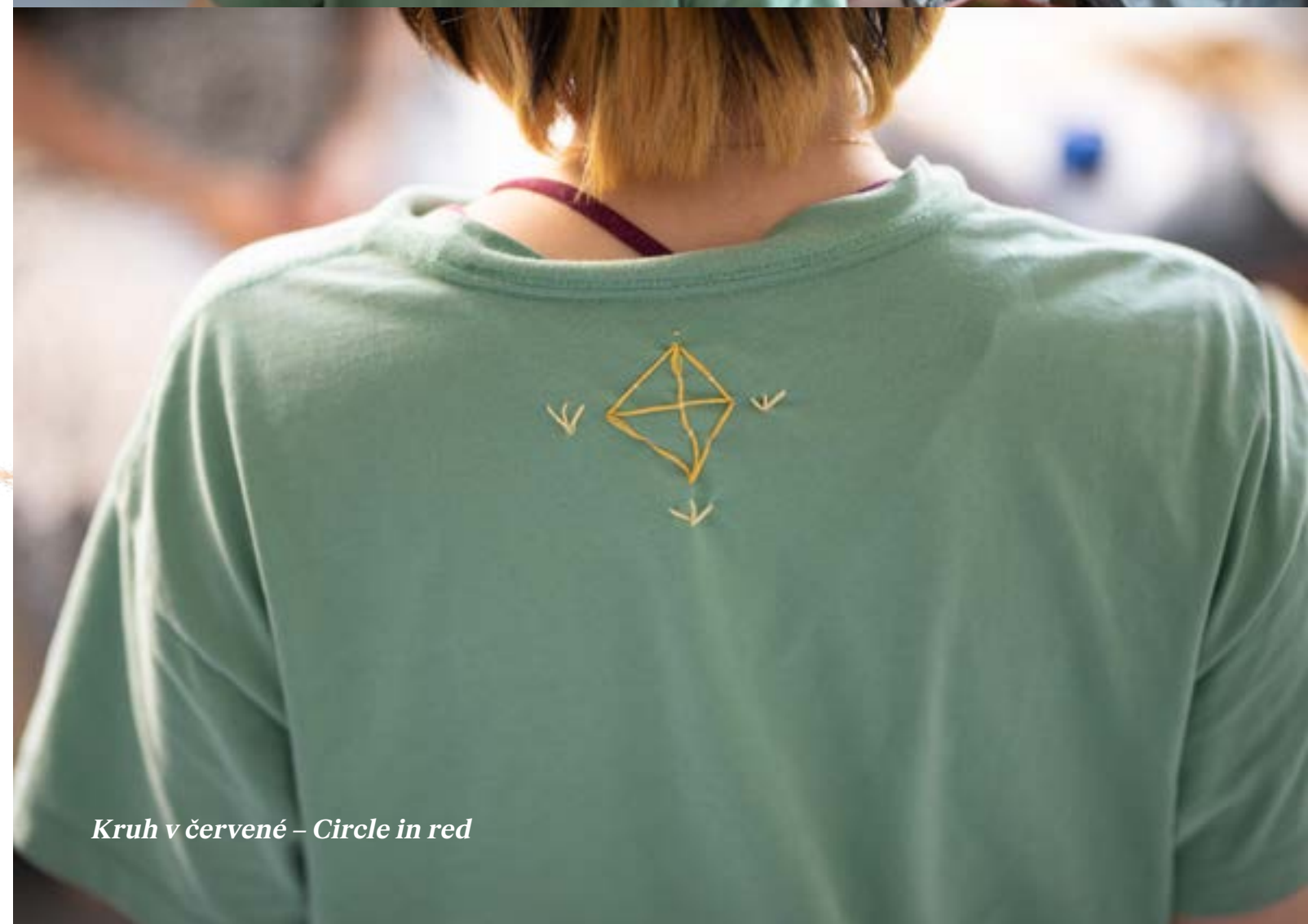
Kruh v červené – Circle in red