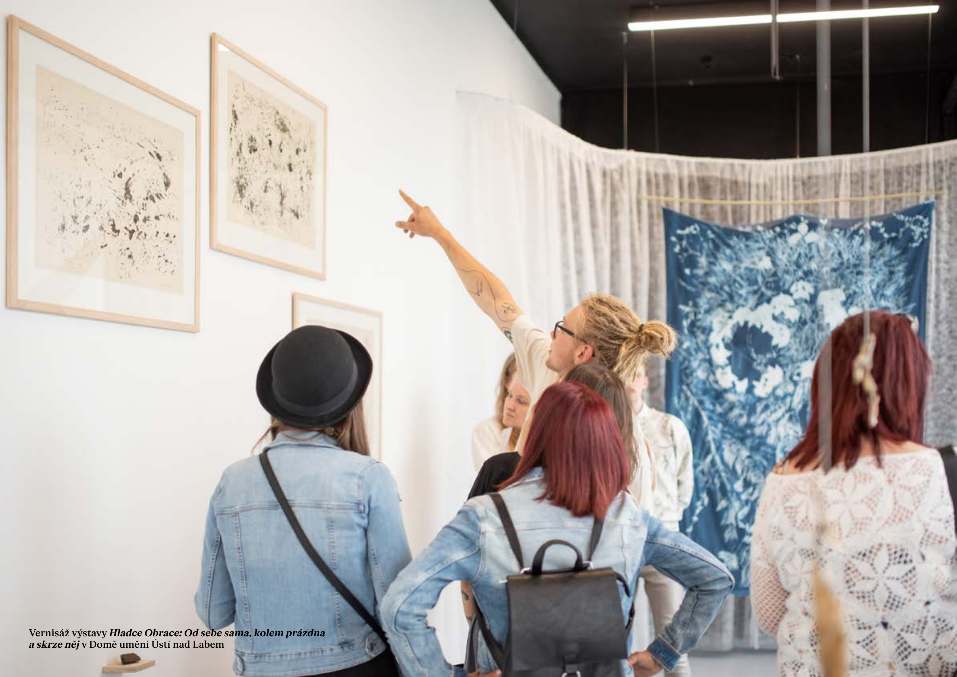
Vernisáž výstavy Hladce Obrace: Od sebe sama, kolem prázdná a skrze něj v Domě umění Ústí nad Labem